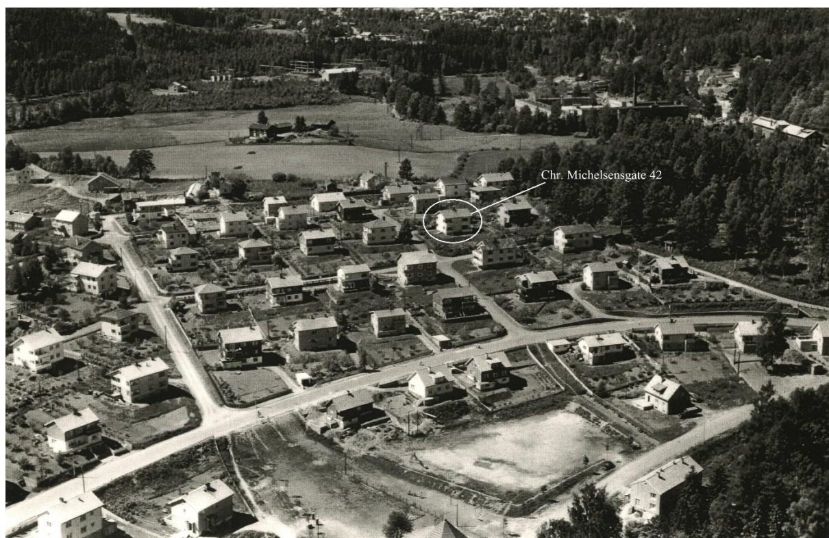
Familien Jaffe bodde i Chr. Michelsensgate 42 da de ble arrestert i 1942.