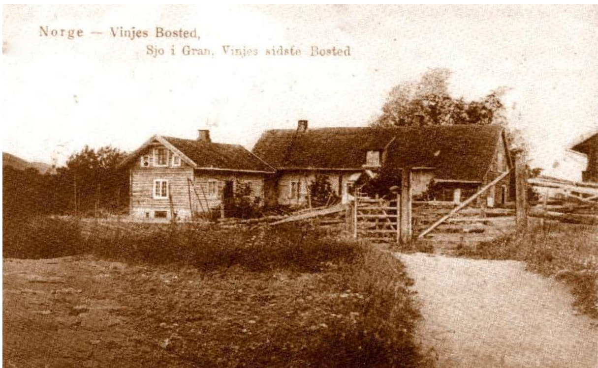
Sjo på begynnelsen av 1900-tallet.