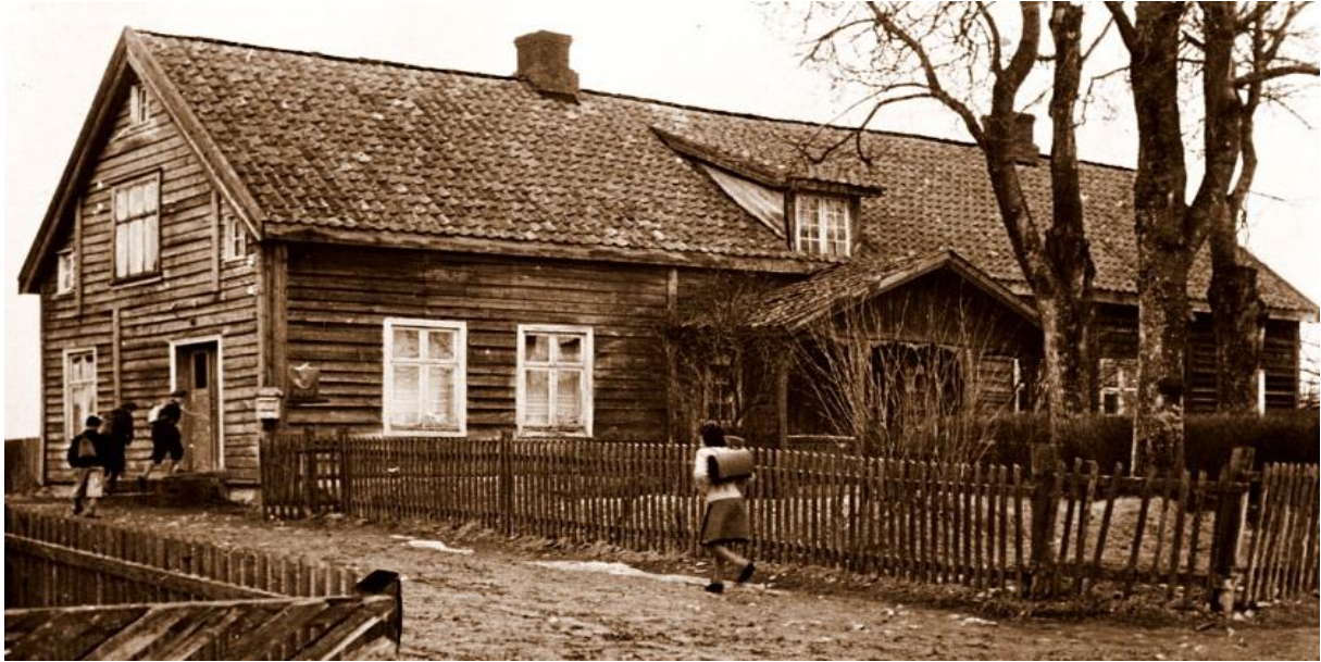
Sjo 1947.