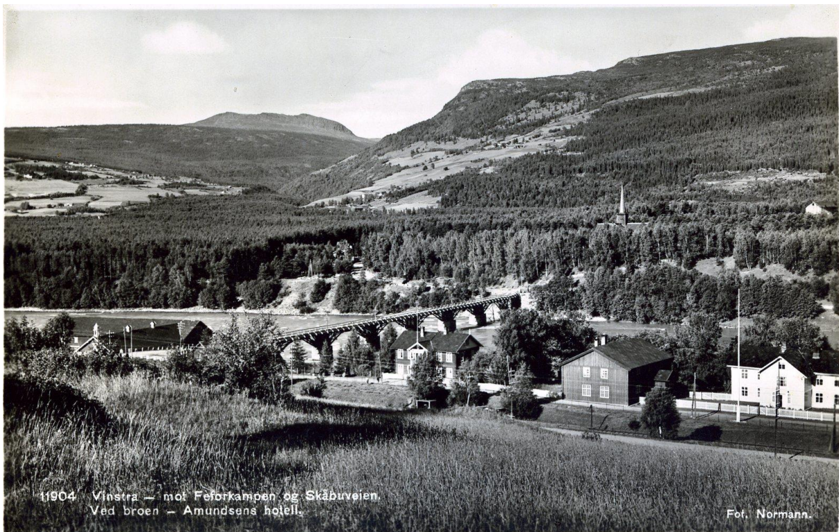
Sundbrua på Vinstra. Søndre Byre til venstre for brufoten.