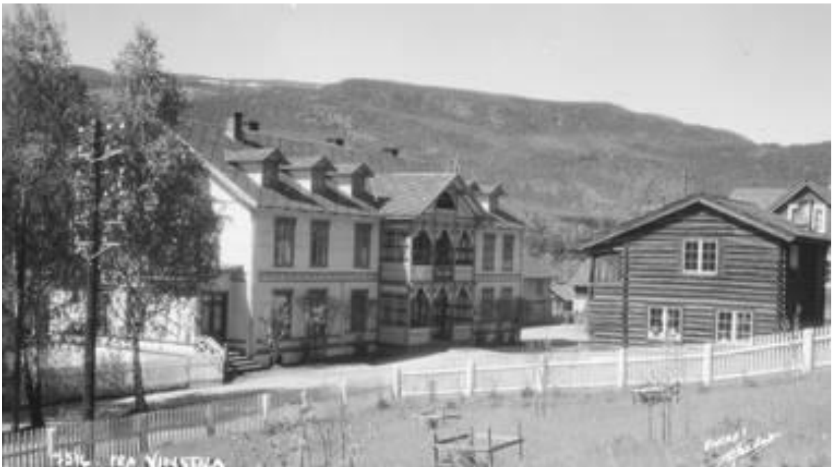
Vinstra hotell 1896