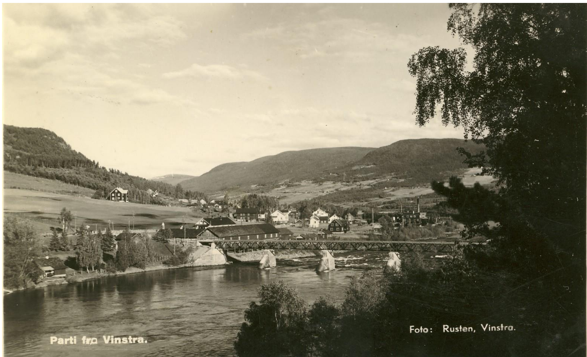
Parti fra Vinstra.