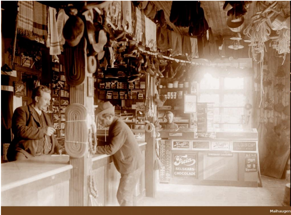
Hvattums landhandel på Vinstra